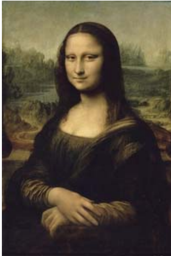
4) Leonardo da Vinci, La Gioconda, Musée du Louvre, Parigi Olio su tavola

Nella famosissima opera di Leonardo, “ La Gioconda ”, possiamo notare che la composizione dell’opera ha una struttura a forma piramidale. La giovane donna è in posa davanti ad un parapetto, l’inquadratura è allontanata rispetto alla tradizione fiamminga e il ritratto è incentrato anche sul busto e sulle mani e non più solo sul volto. Compare, così, una quantità maggiore di particolari: il vestito che, anche se sobrio, denota l’ estrazione sociale di lei; le mani, espressive e reali quasi quanto il volto, poggiate sopra ad un bracciolo. Il busto è ancora posto di tre quarti, mentre il viso è quasi frontale. Per quanto riguarda la tecnica chiaroscurale, possiamo notare che alla figura rappresentata, mancano totalmente le linee di contorno delle forme e dei volumi e le parti in luce, come il petto e le mani, sono molto