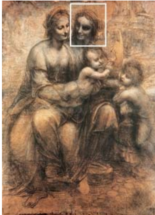
2) Leonardo da Vinci, Sant'Anna, la Madonna, il Bambino e San Giovannino