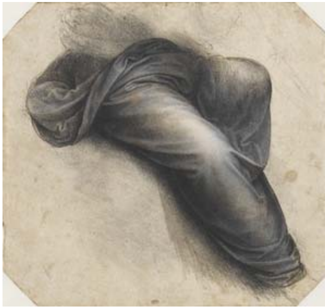
1) Leonardo da Vinci, Drappeggio delle gambe di una figura seduta, Musée du Louvre, Parigi, inv. 2257

Leonardo, fu tra i primi artisti a studiare e ad utilizzare la prospettiva aerea con la quale poteva rappresentare la profondità e la lontananza degli oggetti attraverso l'uso del colore. L'avvento della pittura ad olio, che si avvale di materiali morbidi, plastici e spalmabili, lavorabili più a lungo perché il tempo di essiccazione è più lento rispetto ai materiali a base d'acqua, ha certamente reso possibile la realizzazione dell'effetto sfumato e dell'effetto chiaroscuro , due tecniche fondamentali della pittura, delle quali il maestro è considerato il primo grande inventore. Egli con questo mezzo spoglia le forme della loro determinatezza e le fonde con l'atmosfera che le attornia.