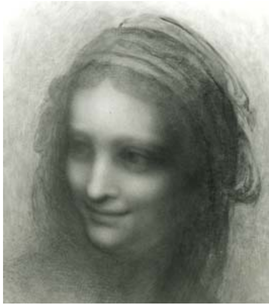
3) Jacques Franck, Copia della testa della Sant'Anna del Louvre Matite colorate su carta incollata su foglio di rinforzo Collezione dell'autore

sfumato impalpabile mediante pennellate micro divise che, nel tempo, divengono impercettibili.